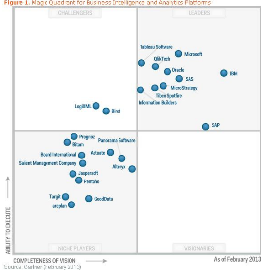
Figure 1. Magic Quadrant for Business Intelligence and Analytics Platforms

Gartner Magic Quadrant for Business Intelligence and Analytics Platforms 2013 (“Магічний квадрант для платформ Business Intelligence і аналітики”)