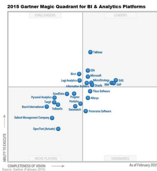
Gartner Magic Quadrant for BI & Analytics Platforms 2015

Далі розглянуті деякі питання інформаційної безпеки в контексті збору, зберігання, аналізу та публікації даних.