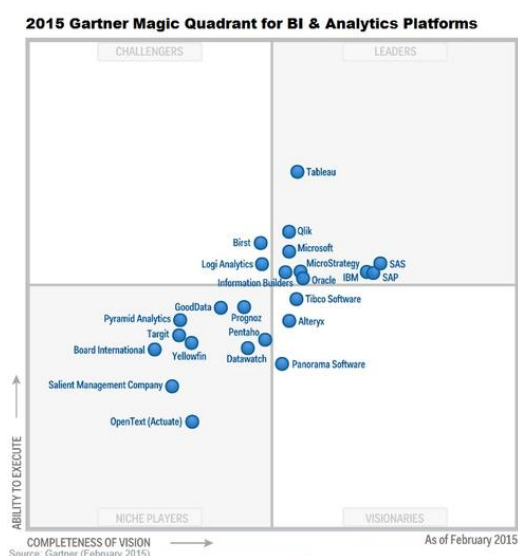
Gartner Magic Quadrant for BI & Analytics Platforms 2015

Далі розглянуті деякі питання інформаційної безпеки в контексті збору, зберігання, аналізу та публікації даних.